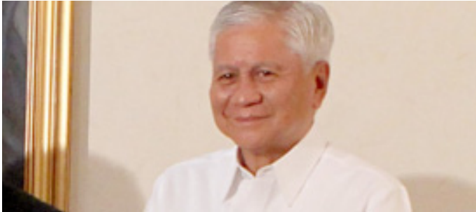
Kalihim ng Ugnayang Panlabas, Hon. Albert F. Del Rosario